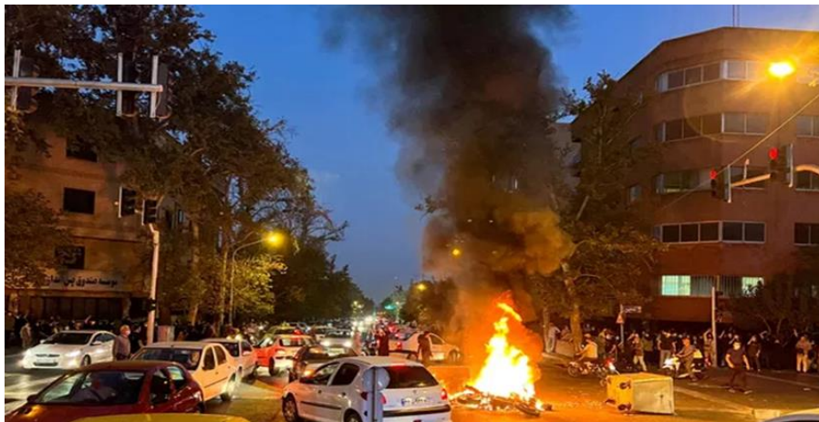
شکل ۲. تصویر منتشرشده در روزنامه لوفیگارو از ناآرامی‌های خیابانی در ایران، پس از مرگ مهسا امینی

منحرف کردن ذهن خواننده از موضوع اصلی اعدام مجرمان تجاوز، و همراه کردن وی با موضوع‌های دیگری است که کشور با آن مواجه است. امروزه، مسئله حقوق بشر روابط ایران و فرانسه را تحت تأثیر قرار داده است. فرانسه هم‌گام با آمریکا معتقد است وضعیت حقوق بشر در ایران نامساعد است. البته، این کشور بارها اعلام کرده است که در چند سال اخیر پیشرفت‌های مهمی در خصوص حقوق بشر در ایران به‌وقوع پیوسته است که می‌بایست ادامه پیدا کند. فرانسه در مقاطع مختلف، پیشرفت روابط با جمهوری اسلامی ایران را مشروط به بهبود و تقویت دموکراسی و احترام بیشتر به حقوق بشر دانسته است که ایران را به شریکی باثبات در منطقه تبدیل خواهد کرد. مسائلی همچون آزادی مطبوعات، حاکمیت قانون، رعایت حقوق اقلیت‌ها و لغو مجازات اعدام از مهم‌ترین محورهای گفتگوی مقام‌های این کشور با تهران در زمینه حقوق بشر بوده است (محمدی، ۱۳۸۸: ۵۳).